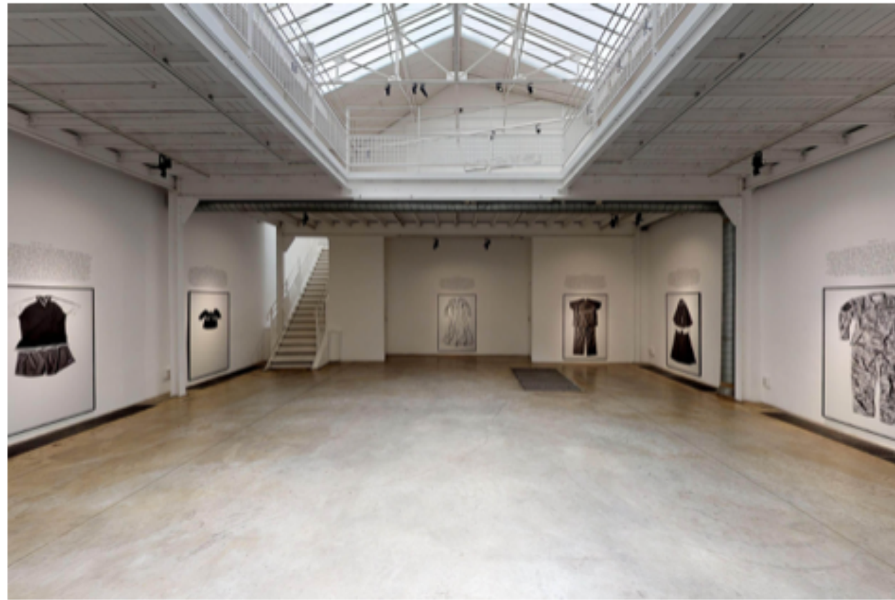
On Rape, Filles du Calvaire, Paris, 2020

On Rape aims to call out institutional rape culture prevalent in societies around the world