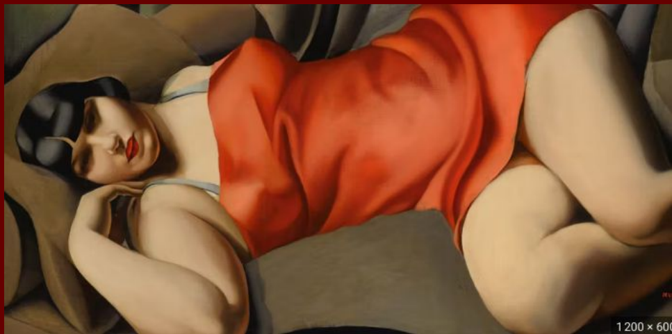
Tamara de Lempicka, La tunique rose , 1927, collection privée