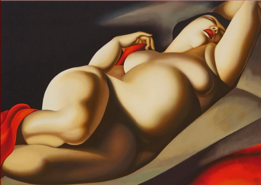
Tamara de Lempicka, La belle Rafaëla , 1927, collection privée

A. La représentation d'une femme s'étant réapproprié son corps : la reprise de la figure de la garçonne .