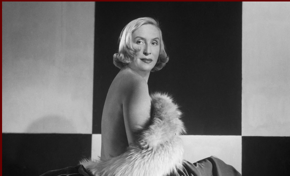
Suzy Solidor photographée par le Studio Harcourt, 1954. © Studio Harcourt / Rmn - Grand Palais via AFP

“Chaque femme je la veux Des talons jusqu'aux cheveux J'emprisonne dans mes vœux Les inconnues