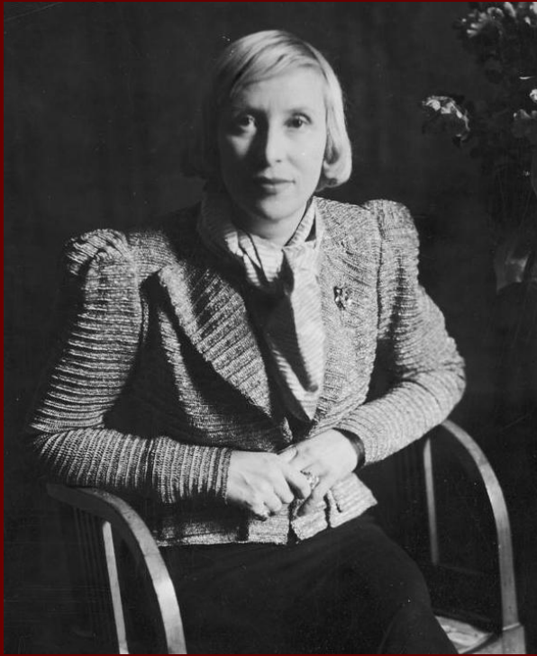
Suzy Solidor, 1938