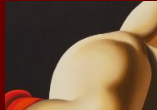
Tamara de Lempicka, La belle Rafaela , 1927, collection privée