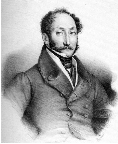
Felice Romani, librettiste d' Un giorno di regno