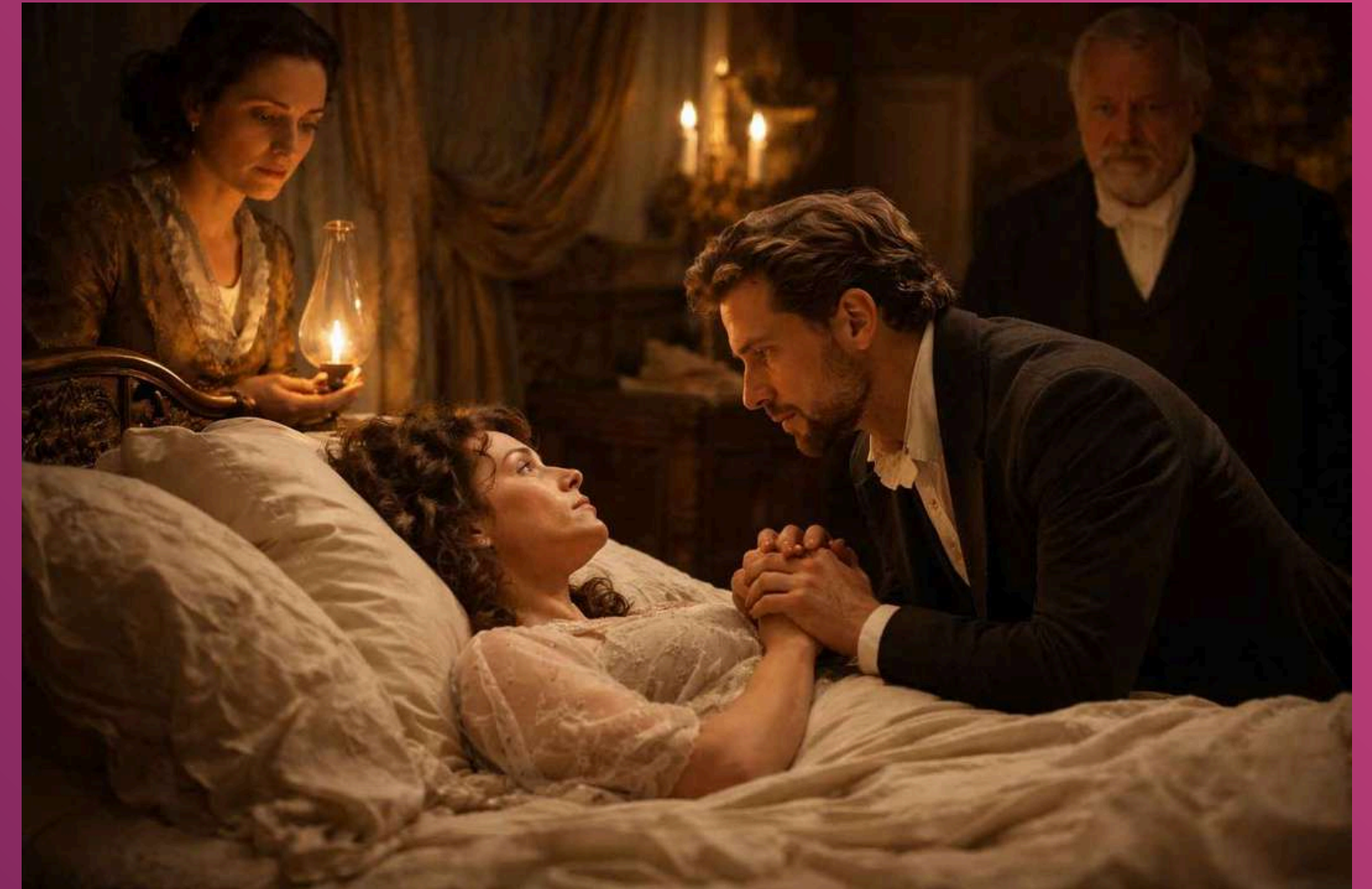
La mort de Violetta

Violetta, plus souffrante que jamais, est abandonnée de tous. Seule Annina lui reste fidèle. Alors qu'à l'extérieur, Paris vit au rythme du Carnaval, le médecin, dans sa visite quotidienne, apprend à la femme de chambre que Violetta n'a plus que quelques heures à vivre. Violetta relit la lettre de Germont, dans laquelle il lui apprend avoir tout révélé à Alfredo, et lui annonce que ce dernier ne tardera pas à venir la retrouver.