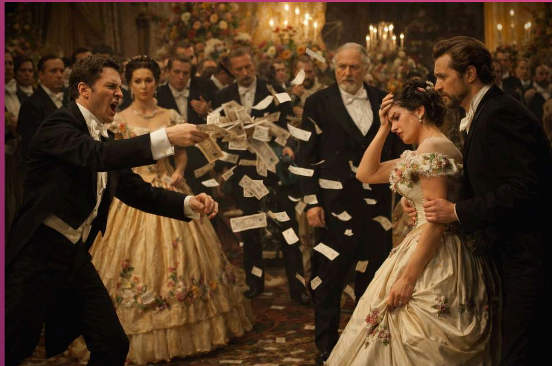
L'humiliation publique d'Alfredo

Une fête bat son plein chez Flora Bernois, une amie de Violetta. Alfredo surgit, il n'a qu'un seul désir: se venger. Il joue aux cartes avec le baron Douphol et gagne une somme considérable. Violetta est partagée entre le désir de s'expliquer et la promesse faite à Germont. Elle finit par prétendre qu'elle aime Douphol. Fou de rage, Alfredo jette l'argent gagné au visage de Violetta devant tous les invités, la "payant" ainsi de ses trois mois d'amour. Violetta s'évanouit et le baron provoque Alfredo en duel. Germont, qui a suivi son fils, lui reproche d'insulter une femme de cette manière.