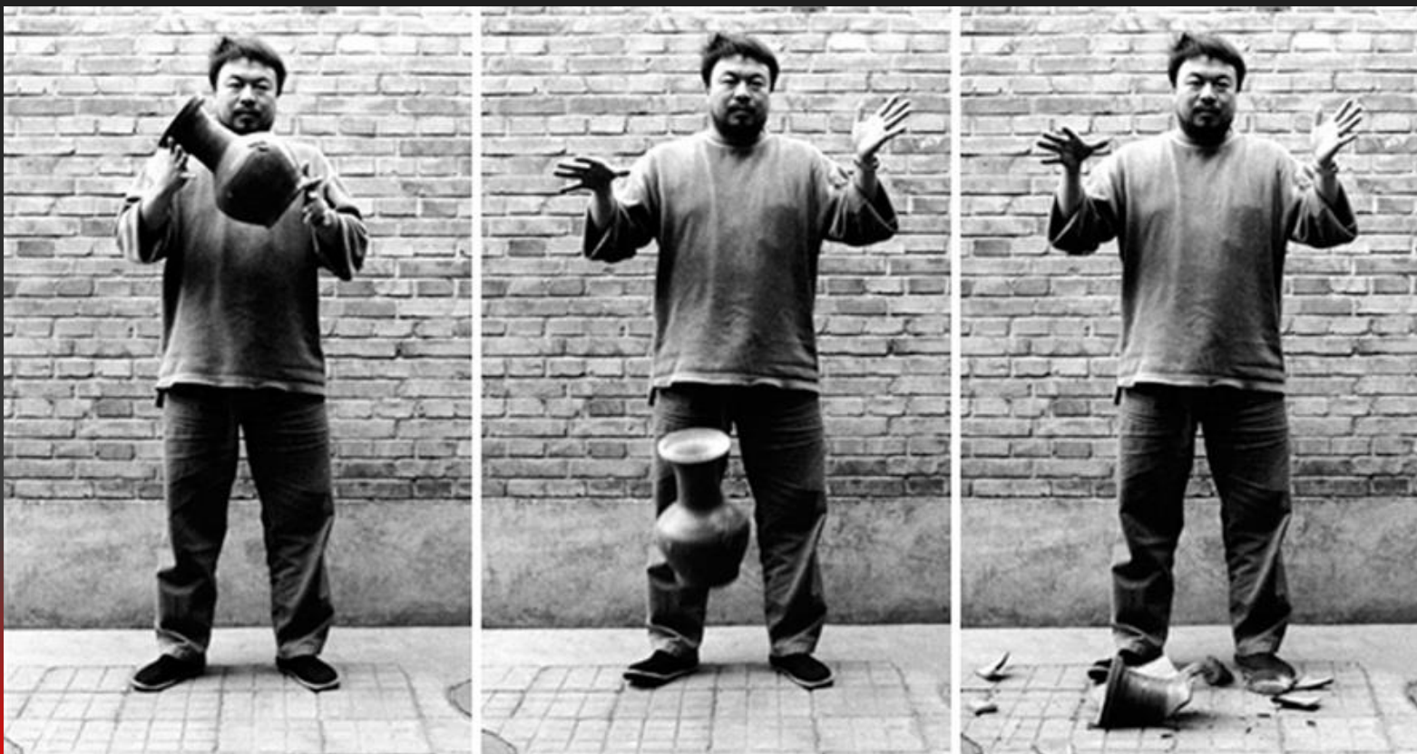
Laisser tomber une urne de la dynastie Han, en 1995