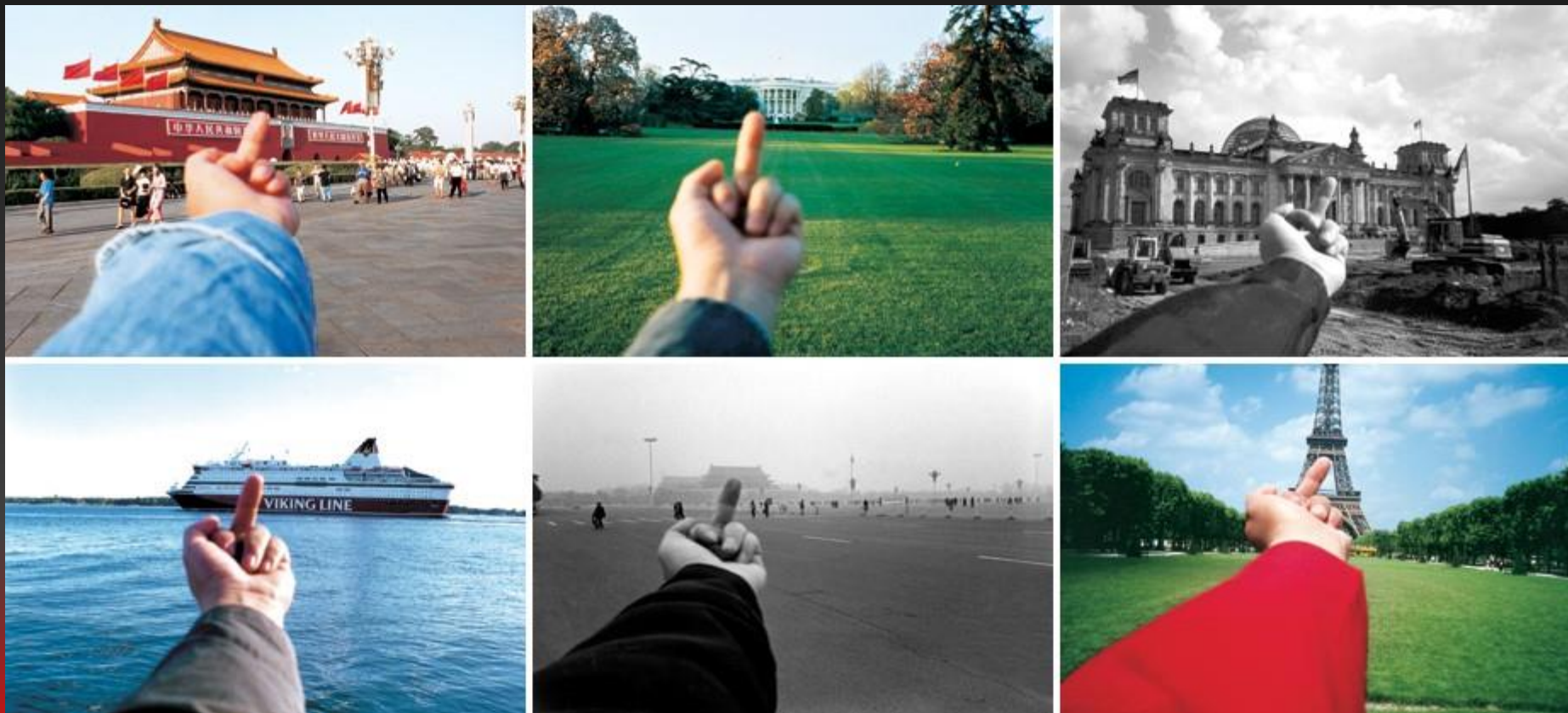
Study of perspective, 1995 à 2003